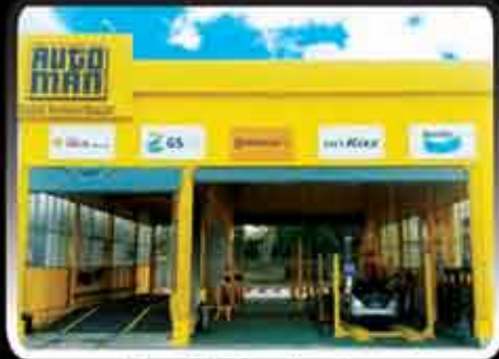
Nay Pyi Taw Center