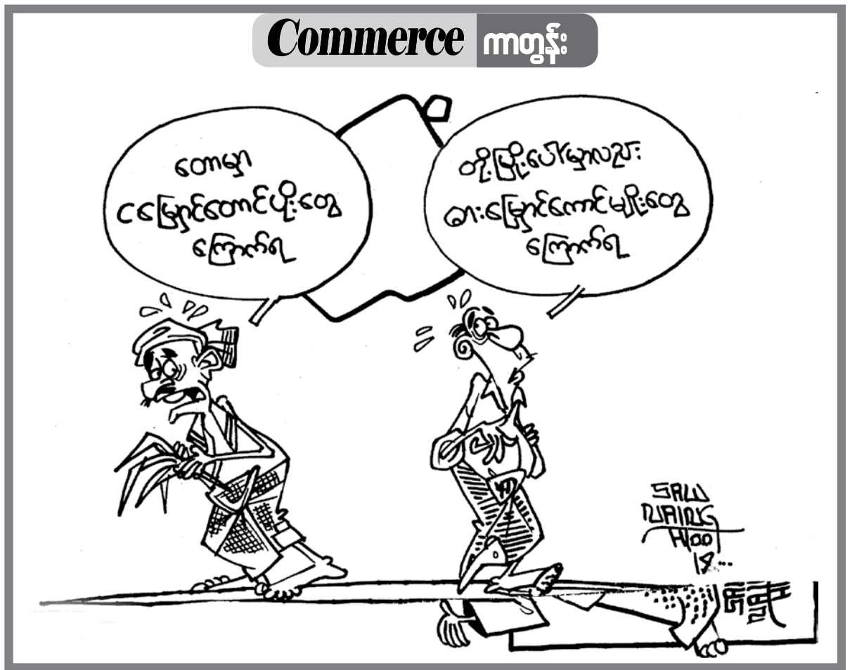
စီးပွားရေးအောင်မြင်ရန် သတင်းအချက်အလက်ကို အခြေခံ

ကိုးကား။ ဖေဖော်ဝါရီ ၂၀ ၊ ၂၅ ရက်ထုတ် ကြေးမုံ၊ အင်တာနက်သတင်းများနှင့်တရုတ်သံရုံး ထုတ်ပြန်ချက်များ။ (စာရေးသူ၏အာဘော်သာဖြစ်ပါသည်။)