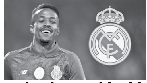
ဟန်နေသစ် စုစည်းသည်

ထို့အပြင် စီရိုနယ်ဒိုသည် အုပ်စုပွဲစဉ်အားလုံးတွင် ဂိုးသွင်းဖူးသည့် ပထမဆုံး ကစားသမား၊ ၁၁ ပွဲဆက် ဂိုးသွင်းယူနိုင်ခြင်း၊ ရီးရဲလ်မက်ဒရစ်တစ်သင်းတည်းအတွက် ချန်ပီယံလိဂ်သွင်းဂိုး ၁၀၁ ဂိုးရှိခြင်း၊ တစ်ရာသီအတွင်း ၁၇ ဂိုးသွင်းနိုင်ခြင်း၊ ခြောက်ရာသီဆက် ဂိုးအများဆုံးသွင်းနိုင်ခြင်းနှင့် ချန်ပီယံလိဂ်ဆုဖလား ငါးကြိမ်ရရှိသည့် ပထမဆုံး ကစားသမားဖြစ်ခြင်း စသည့် စံချိန်သစ်များကို ပိုင်ဆိုင်ထားသည်။