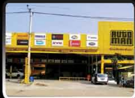
Thitsar Street Center